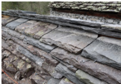
Sèrta A linea di colmo