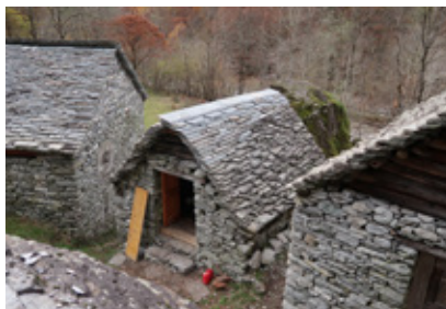
Sèrta A colmo e falde del tetto