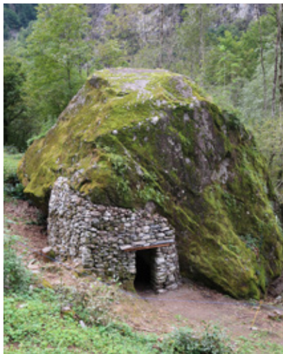
Sèrta Rifacimento splüi